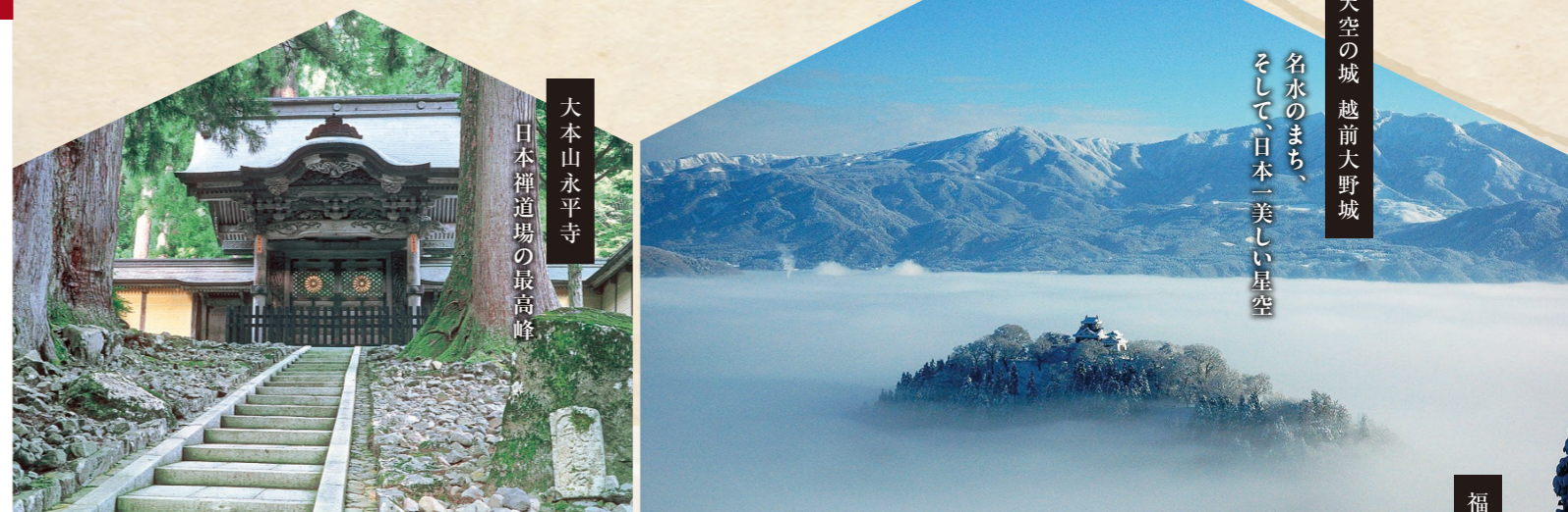
大本山永平寺 日本禪道場の最高峰