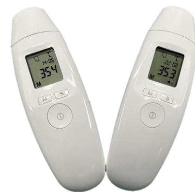
非接触赤外線体温計