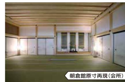
朝倉館原寸再現(会所)