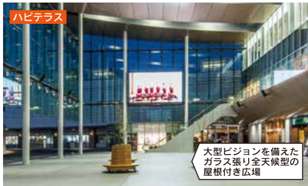
大型ビジョンを備えた ガラス張り全天候型の 屋根付き広場