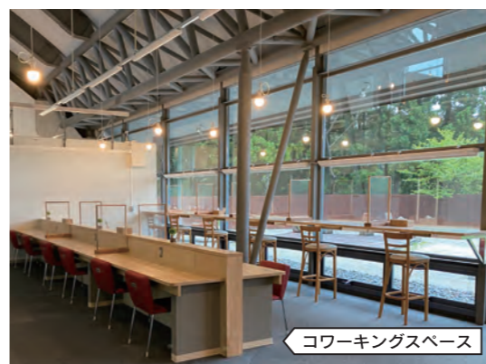
コワーキングスペース