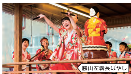
勝山左義長ばやし

花月楼は明治30年に建築された国の登録有形文化財「旧料亭花月楼」をリノベーションして平成29年にオープンしました。懇親会時のアトラクションとして、伝統芸能である勝山左義長ばやしの演芸・体験が可能です。