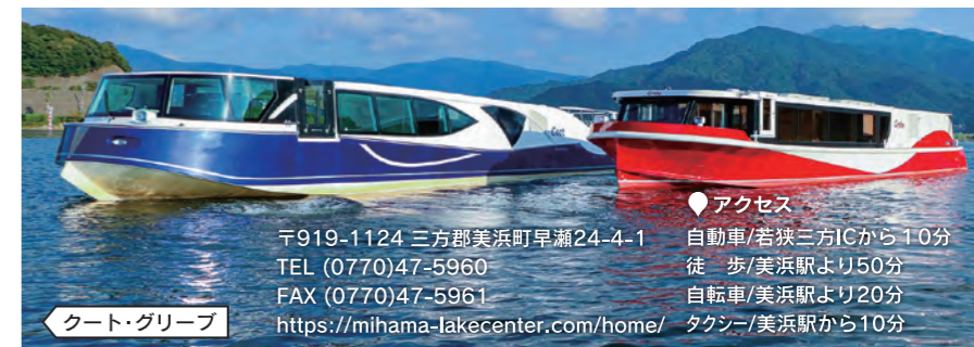
クート・グリーブ

◆アクセス 自動車/若狭三方ICから10分 徒歩/美浜駅より50分 自転車/美浜駅より20分 タクシー/美浜駅から10分