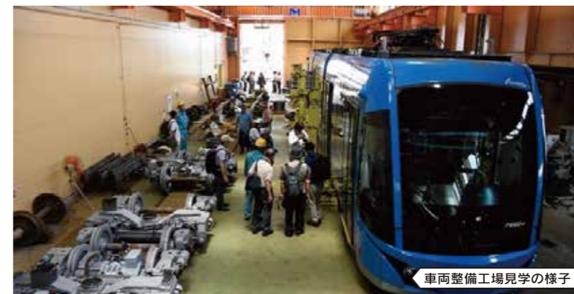
車両整備工場見学の様子