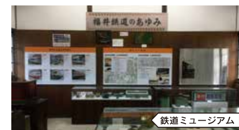
鉄道ミュージアム