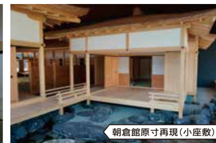
朝倉館原寸再現(小座敷)