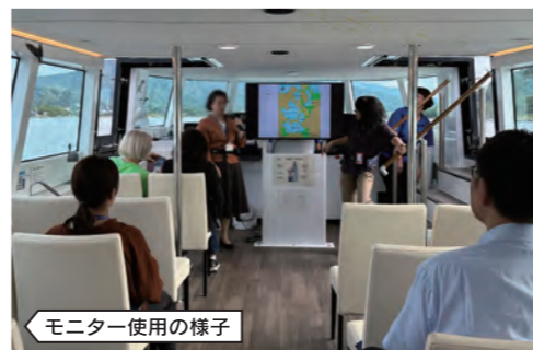
モニター使用の様子