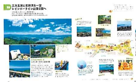
<レインボーライン山頂公園>

時代ごとに陸海の交通の要所として栄えた敦賀は、海辺のリゾートとしても訪ねる人も多いエリア。古くは若狭国と呼ばれた美浜町より西の地域は、かつて朝廷に食材を納めた「御食国（みけつくに）」とよばれ、その歴史を感じる町並みや豊かな海山の幸をお楽しみいただけます。