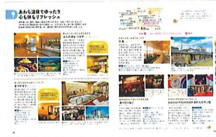
<あわら温泉でゆったり>