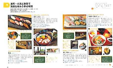
<港町で海鮮を味わう>