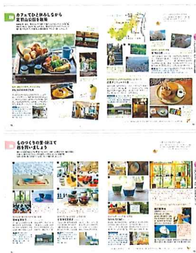
<上: 足羽山公園を散策 下: 鯖江で器を買いましょう>

嶺北と呼ばれる福井県の北部エリアは、和紙や漆器といった伝統工芸が受け継がれる「ものづくりの里」として知られています。季節ごとに美しい日本海の景色や、古き良き町並みなども見どころです。