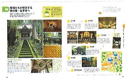
<禅の里・永平寺へ>

絶景で知られる東尋坊や、日本最大級の恐竜博物館など国内外で有名なスポットが豊富な福井。禅の里・永平寺、戦国時代の町並みを復原した遺跡をはじめ、歴史を感じる名所めぐりも外せません。また天然温泉と海の幸が堪能できる宿、地酒や冬の越前ガ二も要チェックです。