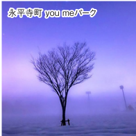
永平寺町 you meパーク