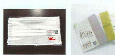
マスク（かにシールつき） と越前和紙マスクケースのセット 30名様

ホームページ： http://www.fuku-e.com/kiritrip Instagram： @kiritrip_fukui フェイスブック： @kiritripfukui にて キリトル福井の情報を随時お届け中！