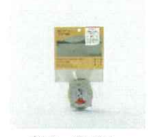
梅たっぶりゼリー

福井県の最も南西部、美しい海や山に囲まれた自然豊かな地域。さまざまなアクティビティを楽しめるだけでなく、古代から都の食文化を支えてきた歴史や若狭塗箸などの伝統工芸もあり、受け継がれてきた文化が今も息づいています。