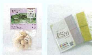
キトリップどれか1商品 と越前和紙マスクケースのセット 10名様