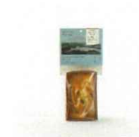
梅パウンドケーキ