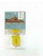
幸せの小さな レモンケーキ