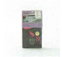
越前甘えび唐揚げせんべい