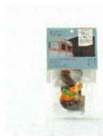
敦賀しよらオレンジ