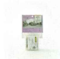
胡麻豆腐のすいーつ