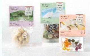
キトリップどれか3商品 5名様