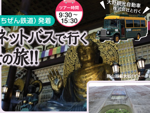
勝山越前大仏(イメージ)

発着地 出発 終了予定 JR越前大野駅 9:30 15:00 勝山駅(えちぜん鉄道) 10:00 15:30