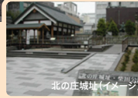
北の庄城址(イメージ)

北の庄城址 観光(30分) 丸岡城 観光(60分) 大野市内昼食と大野城 観光・昼食(100分) 一乗谷朝倉氏遺跡 観光(30分)