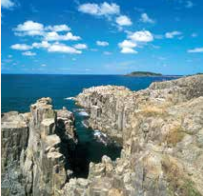
東尋坊（坂井市三國町）

東尋坊是平安時代末期的一位白山平泉寺僧侶，常憑藉其怪力肆意妄為，招致了許多人怨恨。1182年，眾僧趁著宴會時，將酩酊大醉的東尋坊從懸崖上推了下去。從此這座斷崖便被稱為東尋坊，現在已成為代表福井縣的觀光景點。不過還有另一種說法，認為東尋坊其實是位精通文武兩道的傑出僧侶。