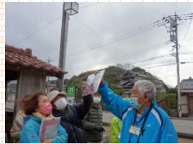
細呂木地区のガイド案内