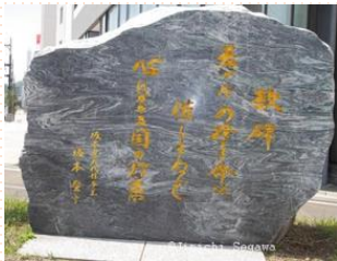
福井市毛矢にある龍馬の歌碑

上記は、誰でもご存じの事柄4点を紹介したにすぎませんが、気さくな人柄の春嶽公、寛容性を備えた方春嶽公と理解し、ふと身近で親しみを感じてしまうのです。