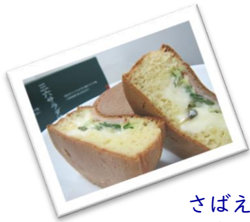
さばえB級グルメ 三六サラダ焼き

9:55 旧瓜生家住宅 (きゅううりゅうけじゅうたく) 神明社の中にある元禄年間に建てられた県内最古の民家で、800年以上も神明社の宮司を務めてきた瓜生家の住宅跡 現存する民家としては福井県内最古建造物として全国的に有名で、国の指定文化財になっています