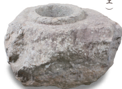
手水鉢 (一乗谷出土)

https://asakura-museum.pref.fukui.lg.jp/