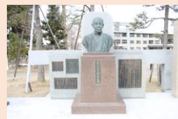
熊谷太三郎先生像と石碑